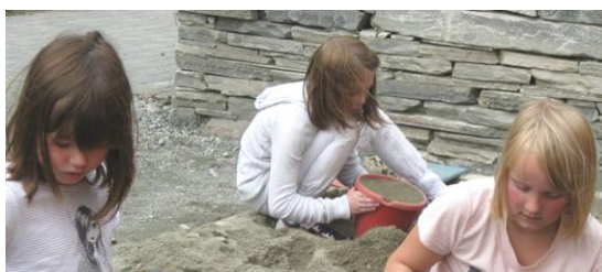
Å leika i sandkassen er framleis kjekt !